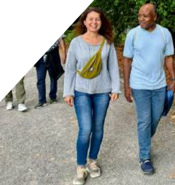
Bild unten: Wandernd Deutsch lernen

Bild oben